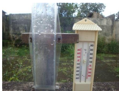
Instalação dos equipamentos de medição