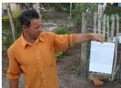
Registro da informação climática diária